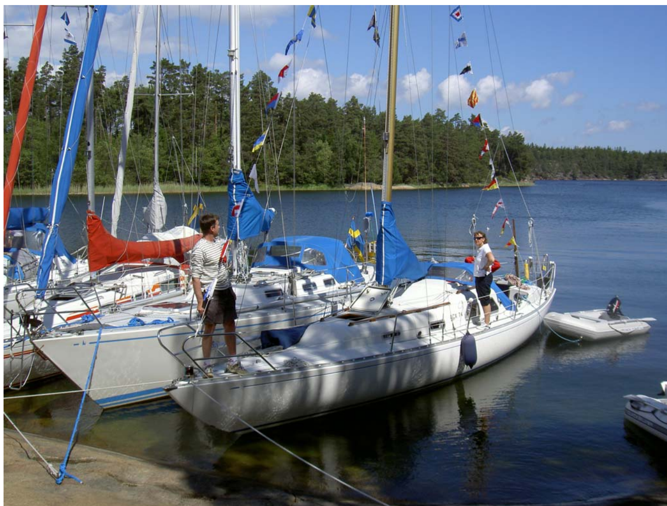
Försmak på sommaren.