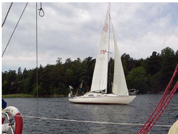
S30 nr 244 sommaren 2008.