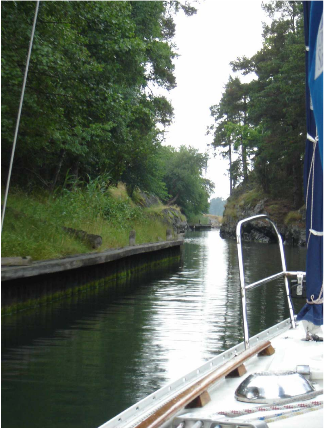
Vinnande bild i S30-bladets fototävling 2006.