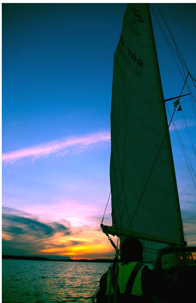
Bilder: Överst nr 232. Till vänster nr 5 Lady in Red, Australien. Till höger nr 182 på väg mot Uppsala(!)