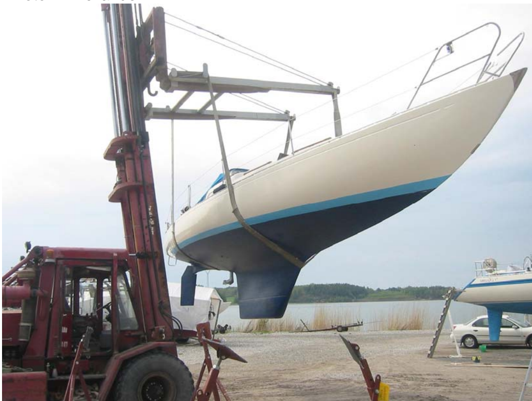
Alternativ till spenat är gaffel(-truck)