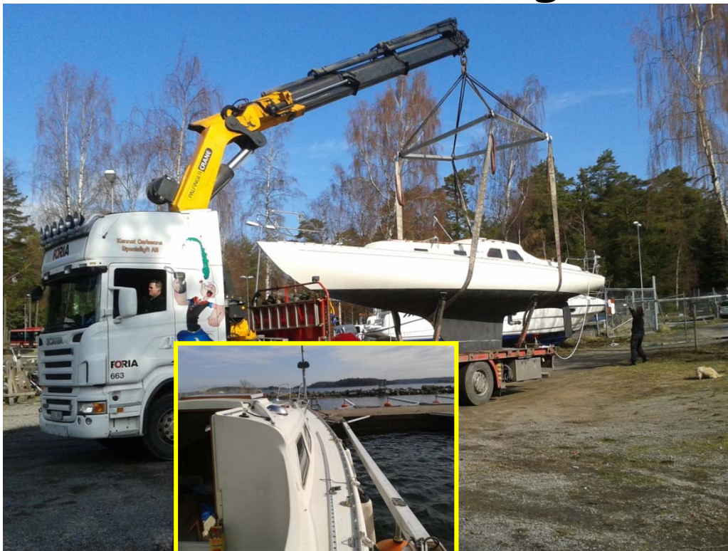
Och visst behövs det spenat och Karl-Alfred för att få nr 209 i sjön...